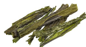
( Ascophyllum nodosum )